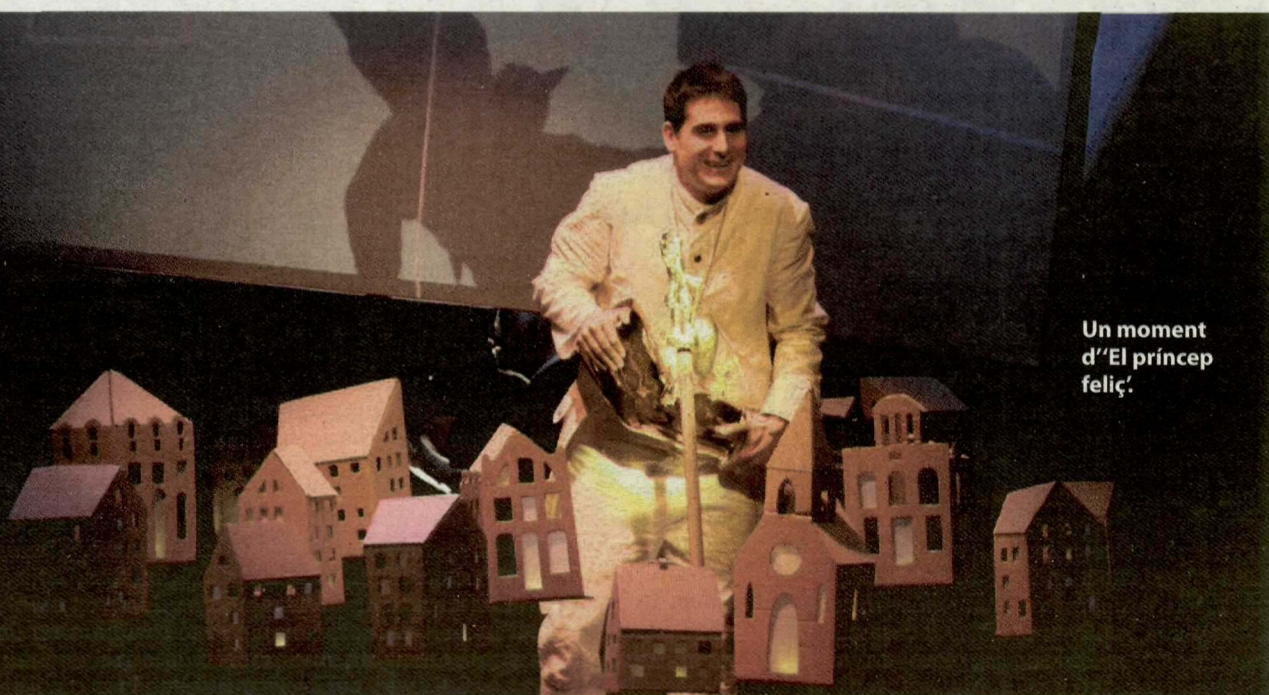
Un moment d'"El príncep feliç".

■ Pedra de tartera: La coproducció amb el TNC s'ha convertit en un èxit de públic i crítica. Ara ve la gira, però també la preparació de la seua nova producció.