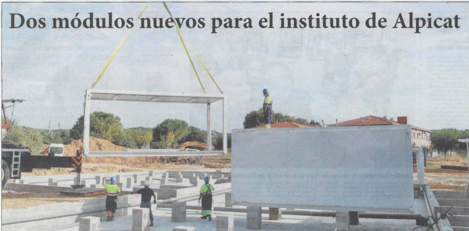
Las obras de la instalación para adaptarse a las normas por la pandemia comenzaron ayer COMARQUES | PÁG. 16