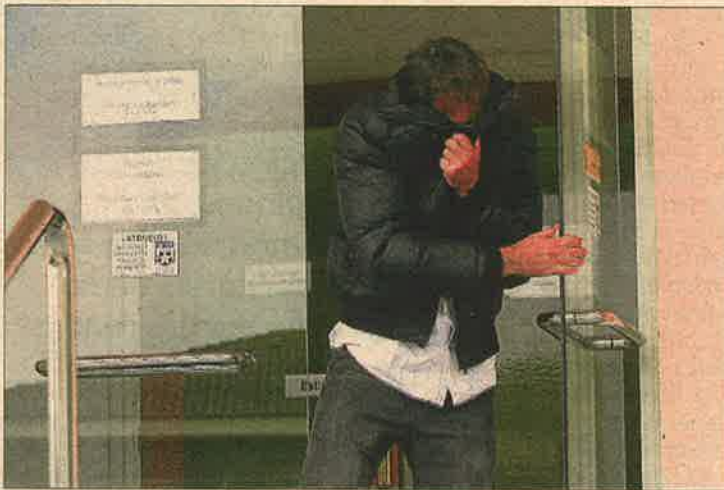
Un dels dos piròmans s'amaga sortint del jutjat

VEGEU ELS VÍDEOS DELS BOMBERS ATRAPATS EN L'INCENDI http://goo.gl/fW3WJo