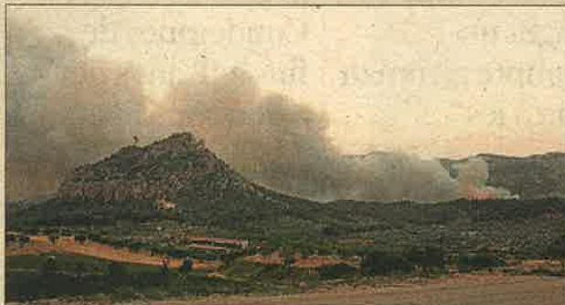
Infem. L'incendi d'Horta de Sant Joan va cremar sense parar durant cinc llargs dies