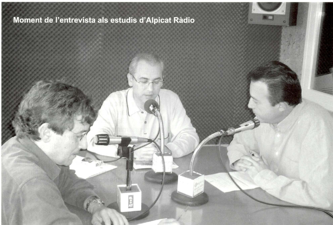
Moment de l'entrevista als estudis d'Alpicat Ràdio

R. Experiències moltes, per a mi és fer un salt qualitatiu. Des de conèixer l'entrallat institucional del Senat i del Congrés, que és on resideix la sobirania popular, fins a poder compartir el teu temps amb alts representants polítics, tant espanyols com estrangers, incloent-hi caps d'Estat. Però sí que el fet de traslladar-me a Madrid ha fet adonar-me'n més que Espanya és un Estat molt ric, culturalment ric, amb moltes personalitats definides i diferents i que realment els catalans tenim poc a veure amb els madrilenys o dels altres indrets d'Espanya. No dic pas que siguem ni millors ni pitjors. Madrid és una ciutat acollidora, però és una ciutat que viu