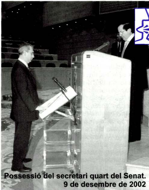
Possessió del secretari quart del Senat. 9 de desembre de 2002

que el Senat s'hauria de reformar per tal que compleixi la tasca que té encomanada constitucionalment. El que es fa al Senat, avui,