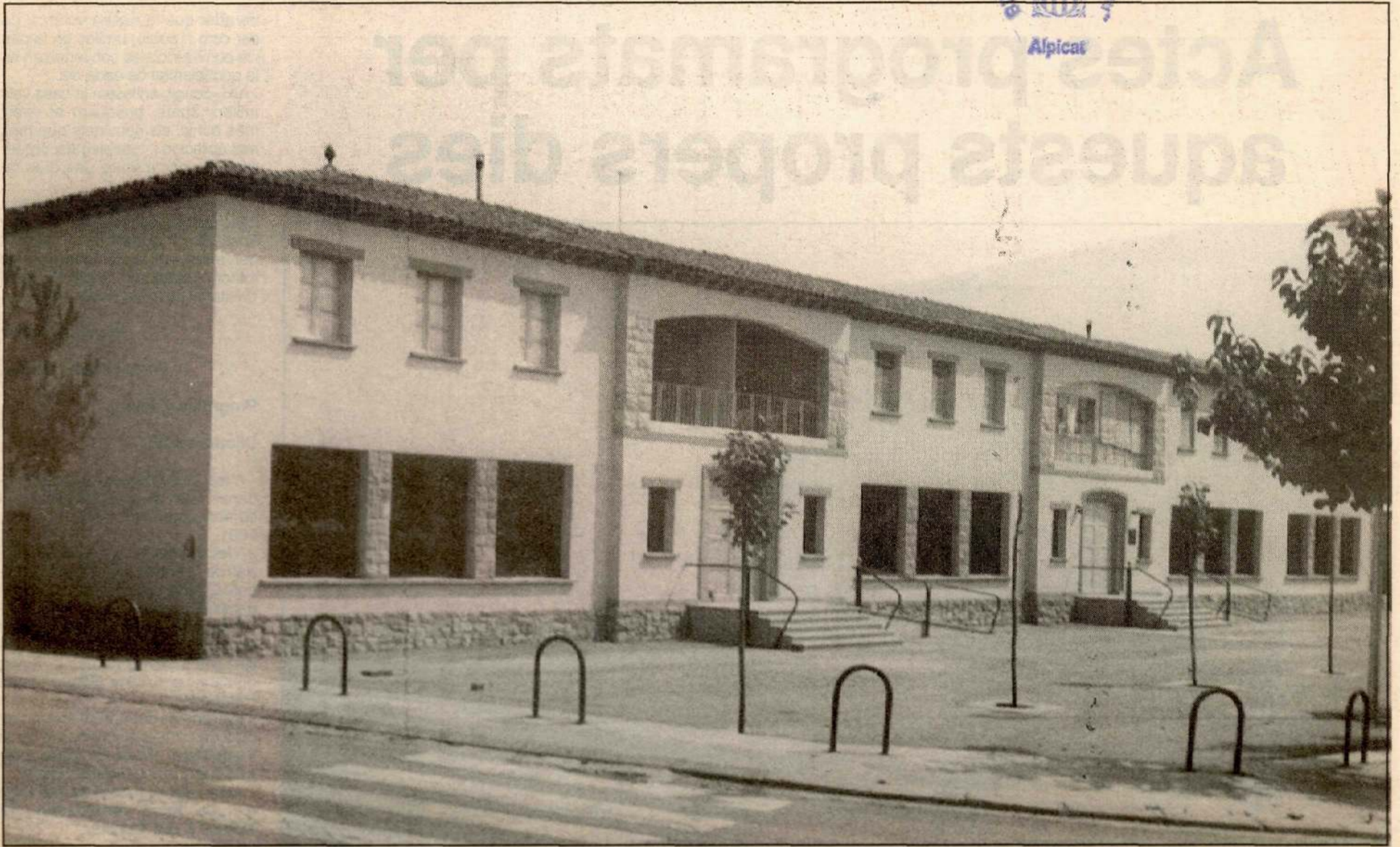
La vila d'Alpicat, una vila en festes.