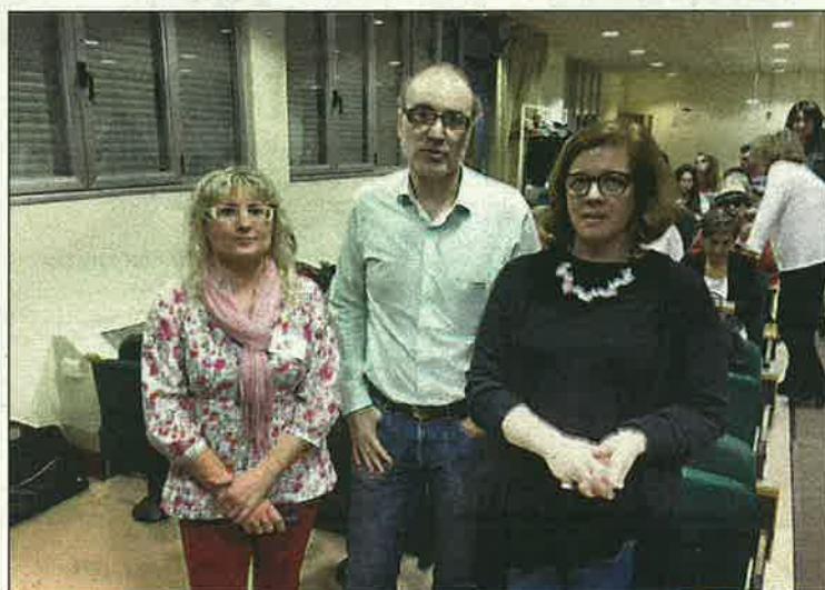
Alpicat celebra una xerrada-col·loqui sobre l'ictus