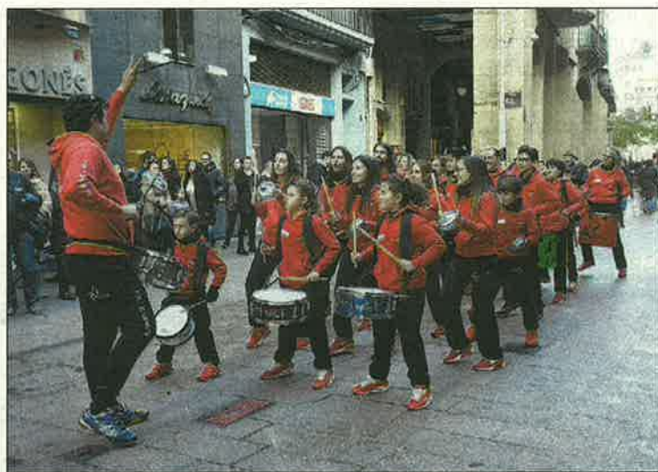
Batucada amb Batucats de l'ala d'Aitona