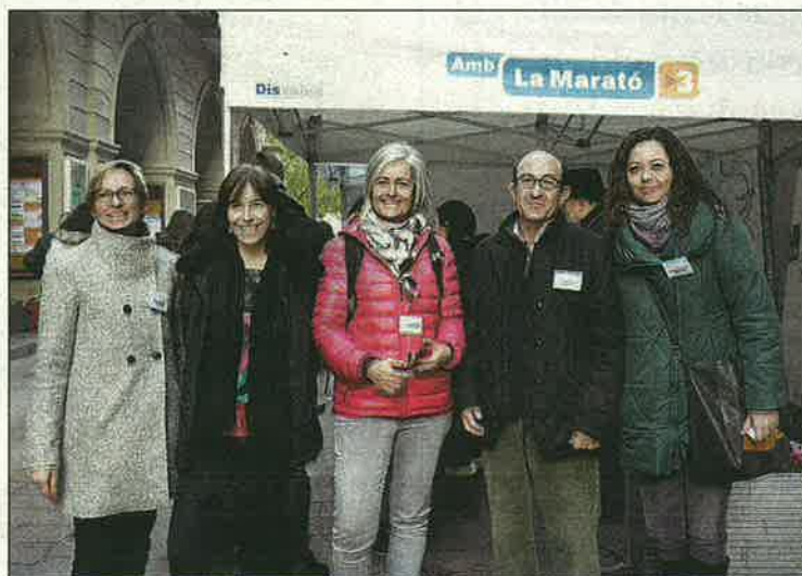
Representants de les associacions lleidatanes