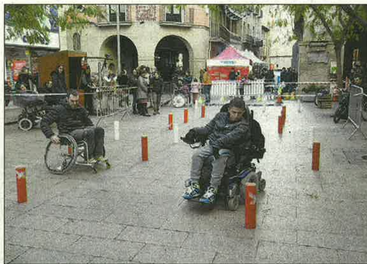
Taller de sensibilització amb cadira de rodes