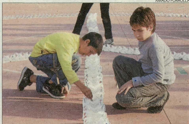
CEIP Frederic Godàs. Els escolars van encendre espelmes al pati.