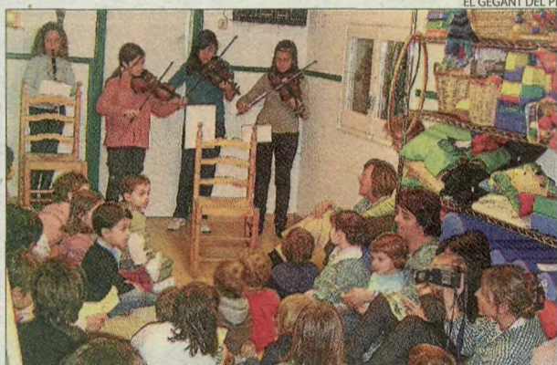
Música per la pau. Concert a l'escola bressol El Gegant del Pi.