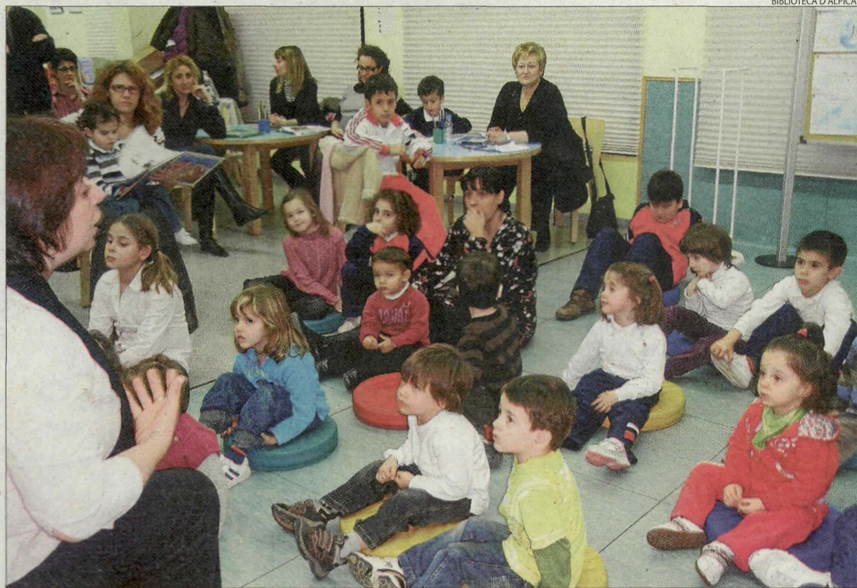
Símbol de la pau a Alpicat. Els més petits van escoltar la història del colom de la pau i van participar en un taller de papiroflèxia.