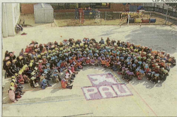
CEIP Almenar. Mosaic gegant per reivindicar la pau.