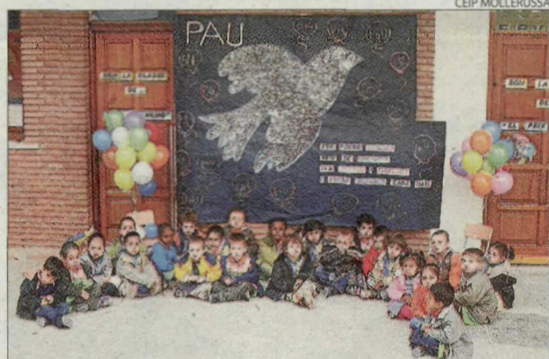
CEIP Mollerussa. Els més petits van pintar un mural gegant.