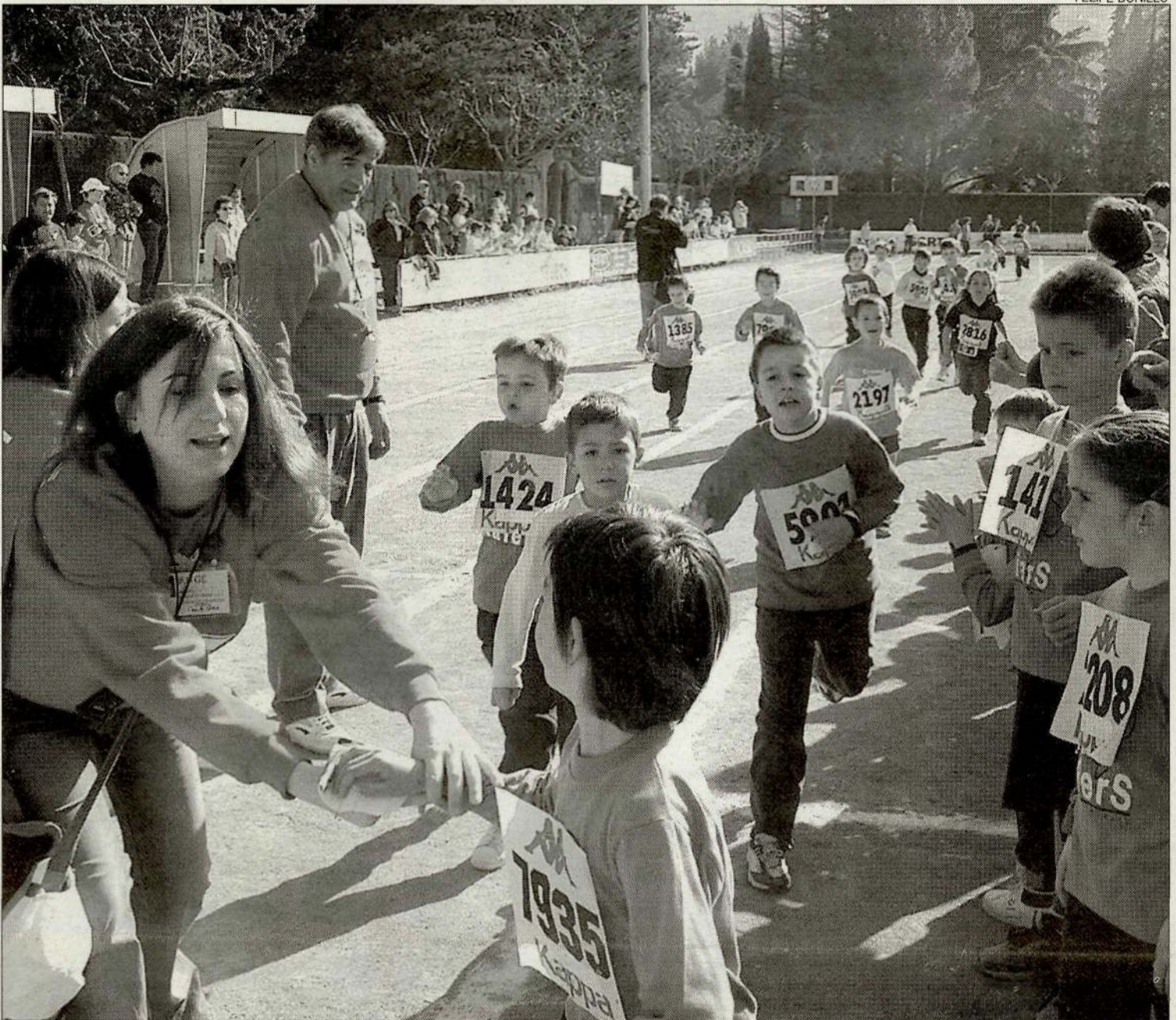
Els primers que van trepitjar les pistes van ser els més petits, que procedien de col·legis de la Pobla, Sort, Tremp i Isona.