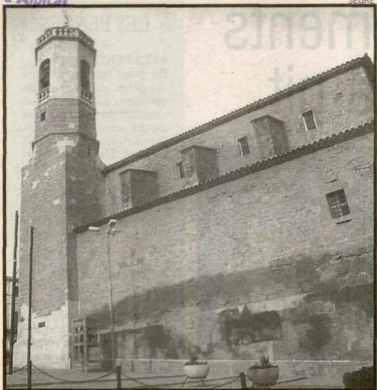
El concurs de pintura ràpida té com a motiu els indrets d'Alpicat.