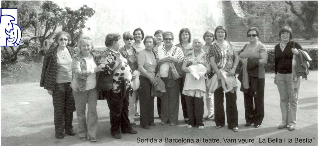
Sortida a Barcelona al teatre. Vam veure "La Bella i la Bestia"

creació d'aquesta associació amb un dinar i una festa que esperem compti amb una nombrosa participació.