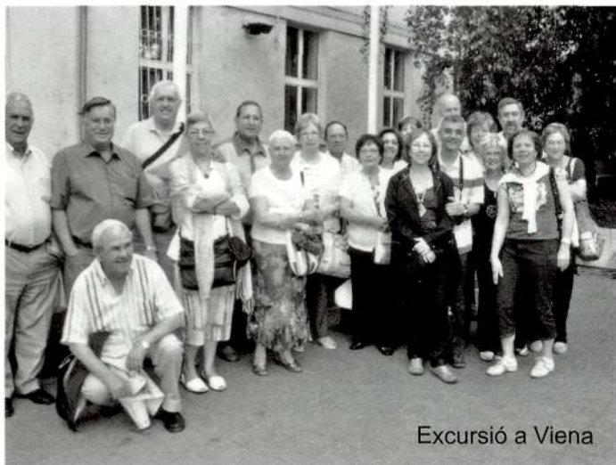
Excursió a Viena

Aquest any, a finals de novembre, commemorarem els vint anys de la