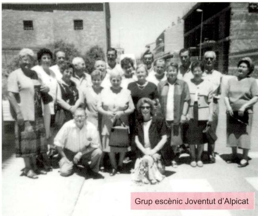
Grup escènic Juventut d'Alpicat

Segurament això servirà per recordar un munt d'anècdotes i moments molt especials viscuts en aquella època i també molts que han passat en aquests anys.