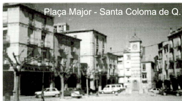
Plaça Major - Santa Coloma de Q.

13 km més enllà i al final de la comarca, Santa Coloma de Q. Manté una forta identitat segarrenca car ha estat històricament i tradicionalment vinculada a aquesta comarca. Encara manté un interessant nucli medieval,