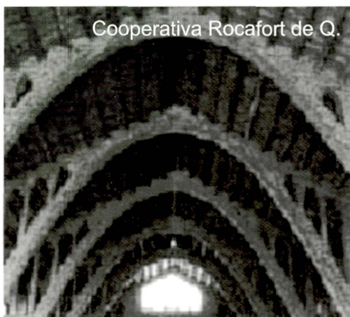
Cooperativa Rocafort de Q.