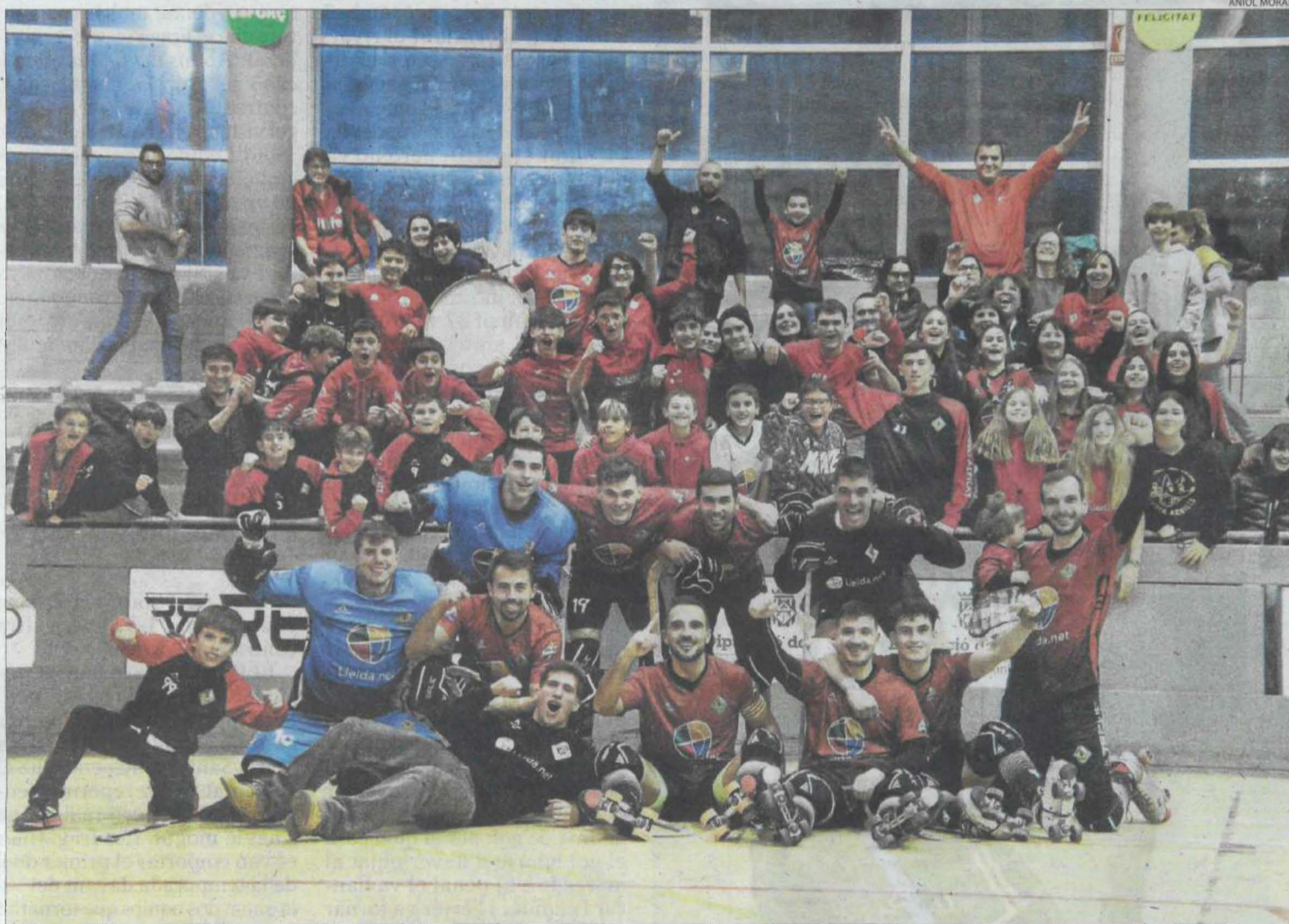
Els jugadors del Lleida.net Alpocat celebren el triomf amb aficionats i nens i nenes del planter del club.