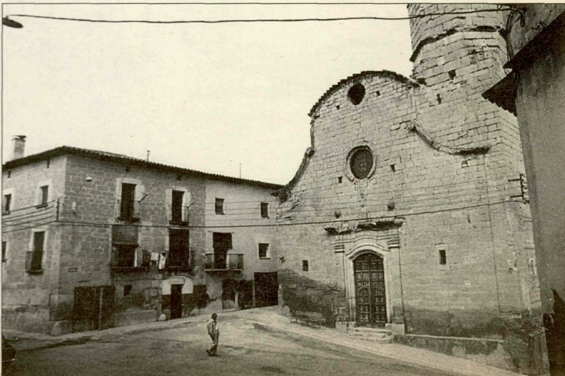
Els actes han estat organitzats per l'Ajuntament de la vila.

El repic de campanes i l'esclat de coets anunciaran l'inici de la Festa Major