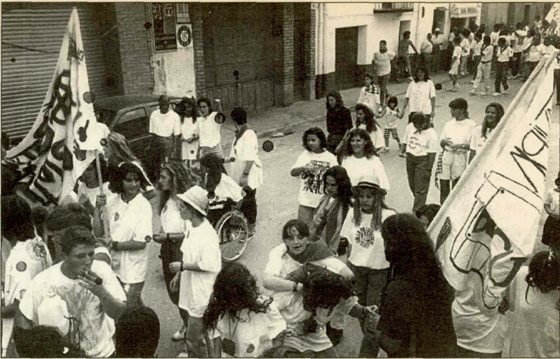
Els veïns sortiran al carrer per gaudir de la festa.