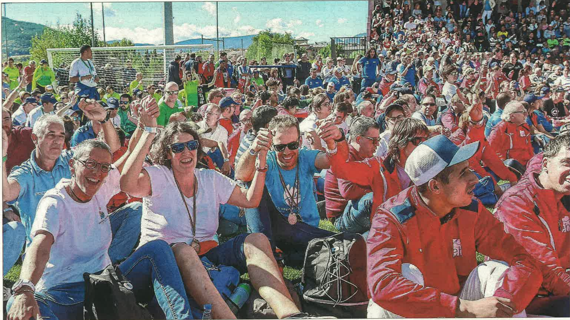
Un grup d'assistents a la cerimònia de cloenda dels Jocs Special Olympics, ahir al camp de futbol de la Seu.