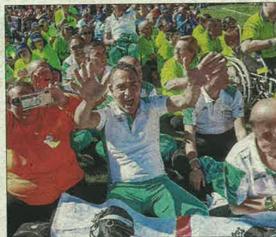
Un moment de la cerimònia de cloenda.