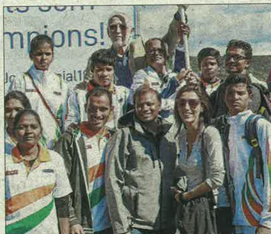
Equip de bàdminton de l'Índia.