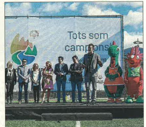
Les autoritats en un moment de la celebració.