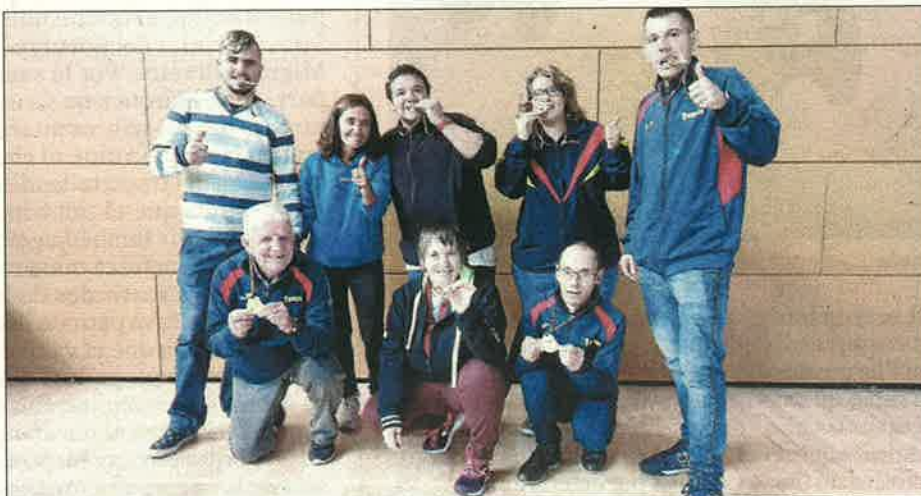
Equip de bàsquet de la Fundació Aspros.