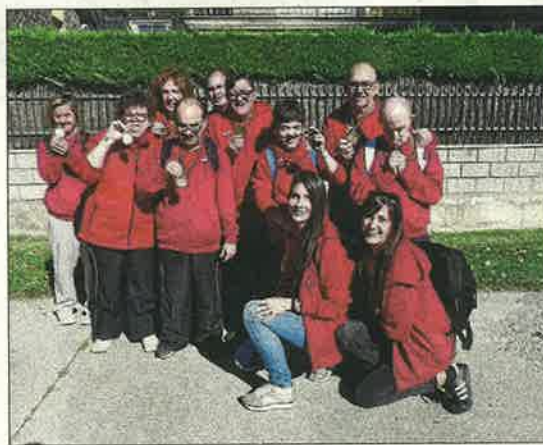
Un grup d'esportistes d'Acudam.

Els Jocs es van tancar amb una gran abraçada col·lectiva entre els assistents, mentre es recollia la bandera i s'apagava el foc. Ara toca preparar els següents.