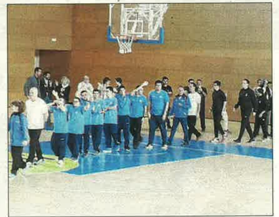
Equip d'Asvolcall Down Lleida.